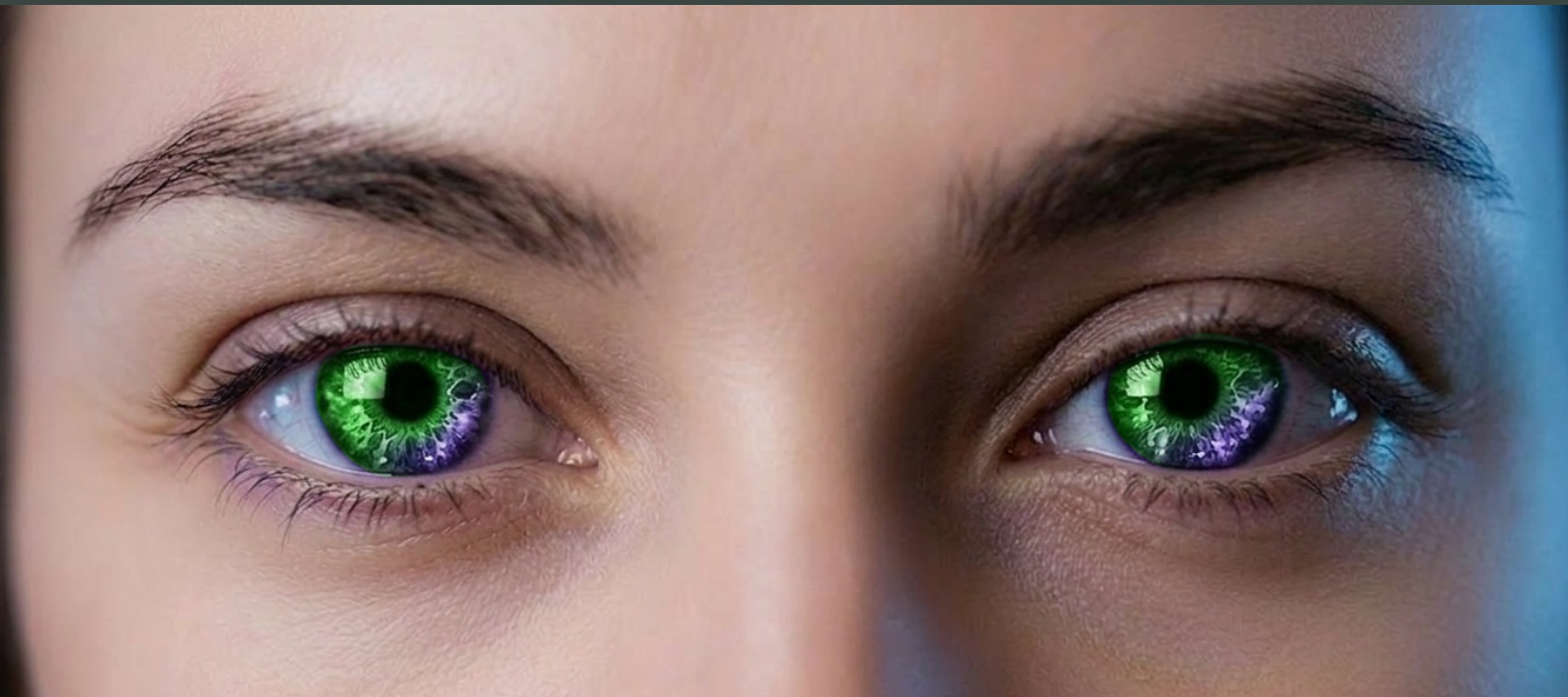
immagine generata con IA