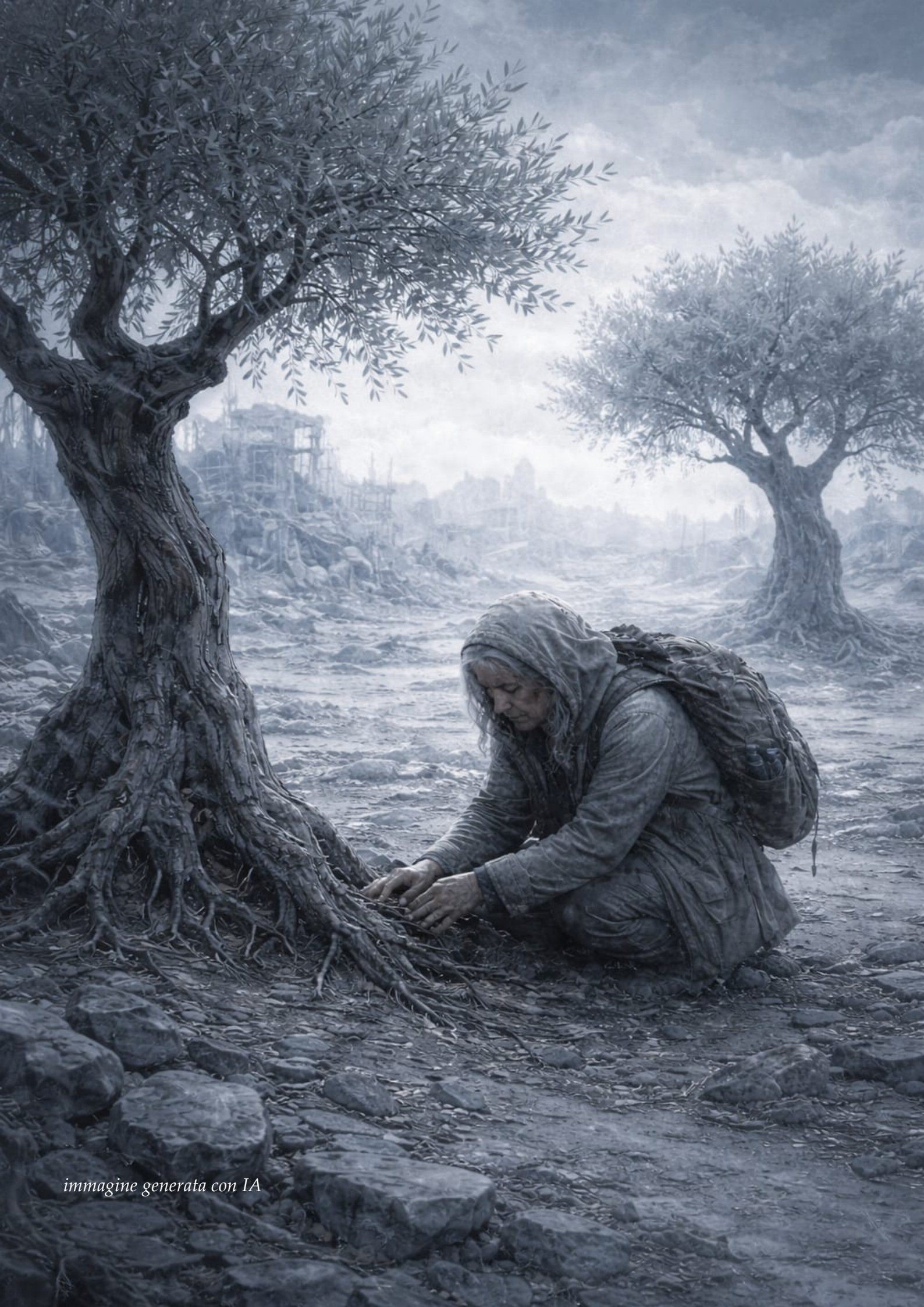
immagine generata con IA